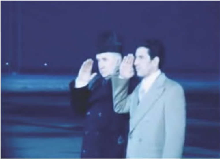
زيارة رسمية لعبد السلام جلود لموسكو واستقباله في المطار من قبل أليكسي كوسيجن، الاتحاد السوفياتي، 1978 / 2 / 15.